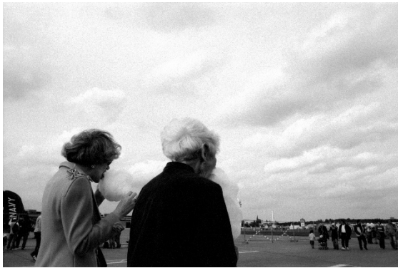
© Holger Biermann, Berlin, 2006, Tempelhofer Feld

Berlin, den 26.07.2022. Der Fotograf Holger Biermann hält seit 20 Jahren mit seiner Kamera fest, was ihm auf den Straßen Berlins begegnet. Die Ausstellung „ORIGINAL! Berlin“ präsentiert vom 26.08. - 16.10.2022 eine Auswahl seiner Straßenbilder, die Berlin bei Tag und Nacht thematisieren. Er nimmt uns mit auf einen Streifzug vom Ku’damm zum Alexanderplatz, vom Tempelhofer Feld zum Mauerpark. Immer einen Finger am Auslöser, um den Moment festzuhalten.