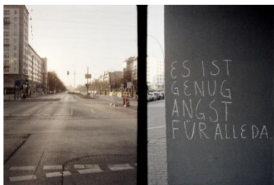
© Holger Biermann, Berlin 2020, „Es ist genug Angst für alle da“