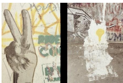
© Holger Biermann, Berlin 2020, „Es ist genug Angst für alle da“